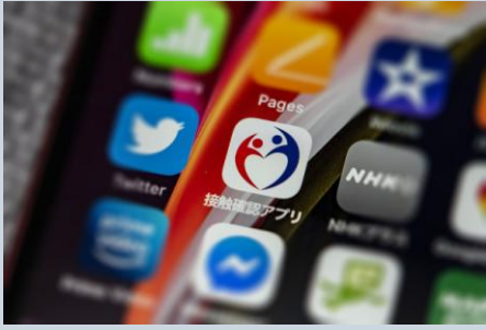
Aplicativo COCOA que rastreia possíveis pessoas infectadas.