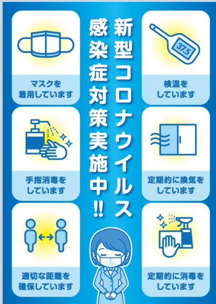
Cartaz publicitário sobre as ações cotidianas da nova normalidade para evitar a propagação de contágios.