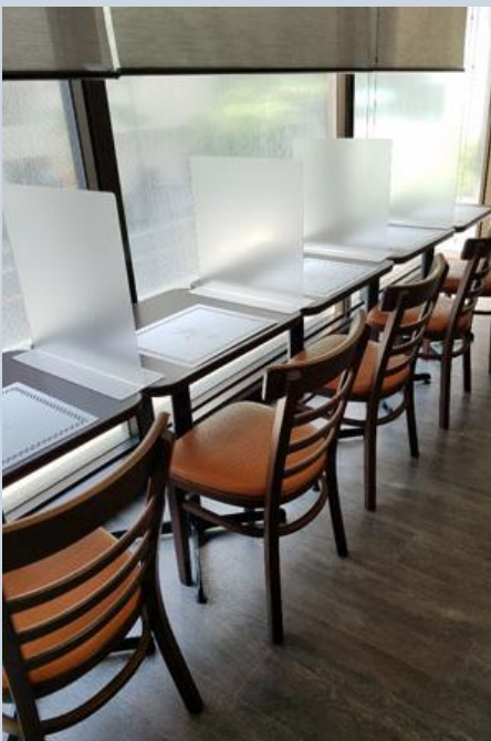
Divisórias nos restaurantes para evitar contato com o spray de fluidos das pessoas ao redor.

A solicitação do governo japonês é para evitar a combinação de três pontos específicos: lugares fechados, aglomeração de pessoas e proximidade física. Estes três fatores combinados se resumem em uma ação única: o distanciamento social . Períodos de certa normalidade são intercalados com estados de emergência e fechamento de cidades (a depender do país). Contudo, a tônica da distância interpessoal permanece em todo o tempo.