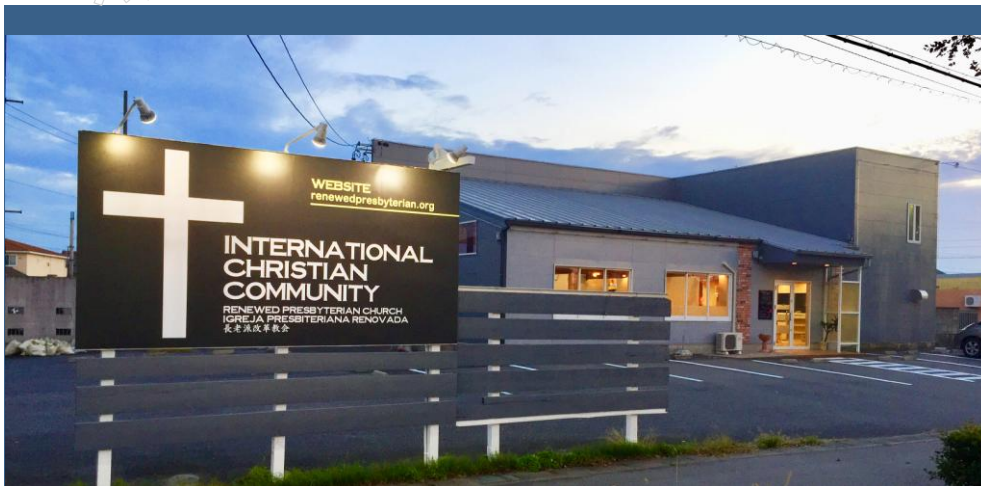
Aspecto externo do templo atual no município de Nishio